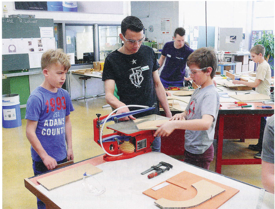
Mit der Dekupiersäge werden die Teile für die Kugelbahn ausgesägt.